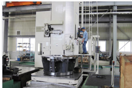
NC 横中ぐり盤 6000×4000