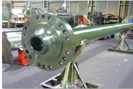
可変ピッチ プロペラシャフト