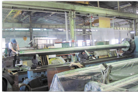
NC 旋盤 φ1200×L10000