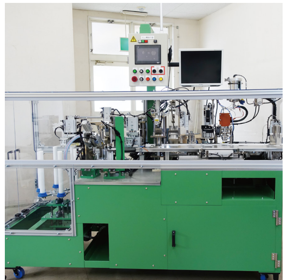
オイルシール製造用自動仕上げ機