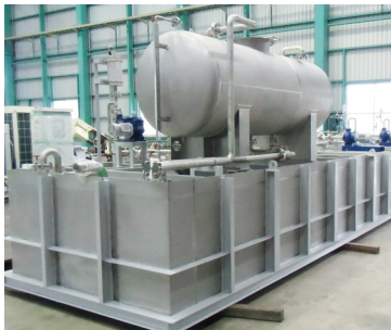
レーザー発生装置の冷却・排水ユニット