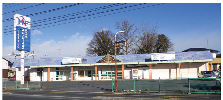
株式会社 エム・シー・エフ

エンジニアリング会社として 強度計算、機構、制御装置などの 設計やメンテナンスの技術的な 部門に対応いたします。