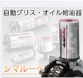
自動グリース・オイル給油器